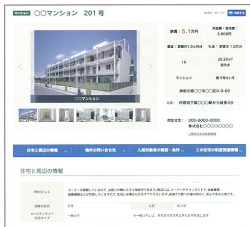
物件掲載ページ (イメージ)